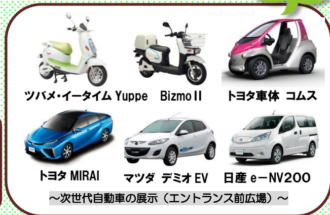
ツバメ・イータイム Yuppe Bizmol II トヨタ車体 コムス