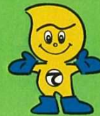
産業廃棄物適正処理のマスコット「てき丸君」