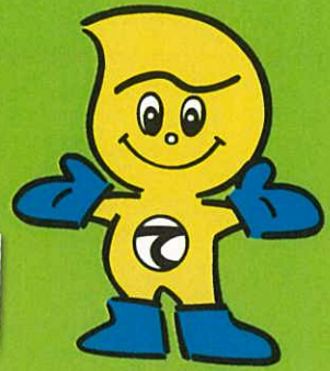
産業廃棄物適正処理のマスコット 「てき丸君」