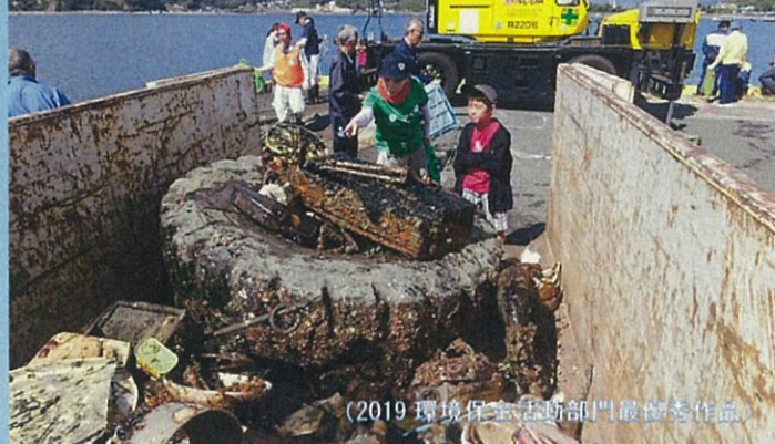
下松市下松第三埠頭