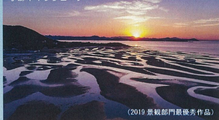
宇部市キワラビーチ