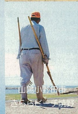
山陽小野田市 さらさら焼野