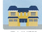
個人教授所 (生け花、茶道など)