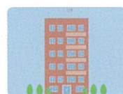
支所・支社・支店