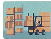
従業員のいる倉庫