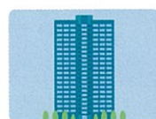
本所・本社・本店