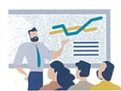
社員研修センター