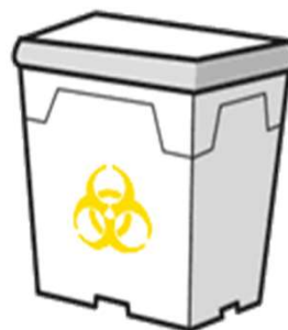
プラスチック製容器