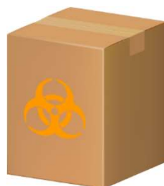
段ボール容器 (内袋使用)