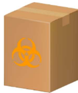
段ボール容器 (内袋使用)