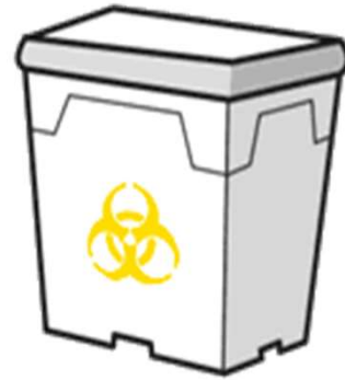
プラスチック製容器